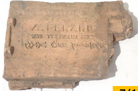
山手で製造されたジェラルル瓦