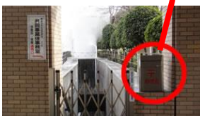
事務室・警備室入口