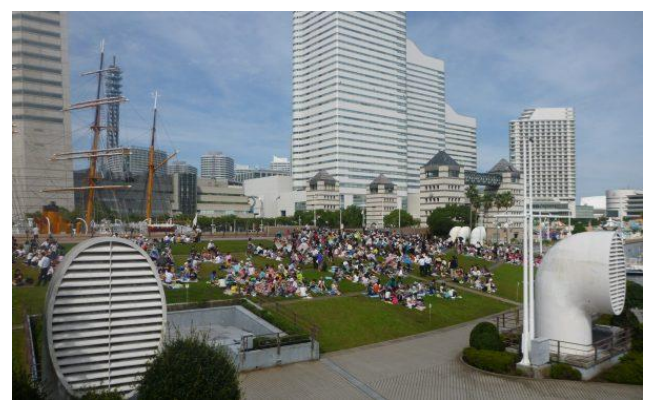
晴天時の芝生広場での昼食