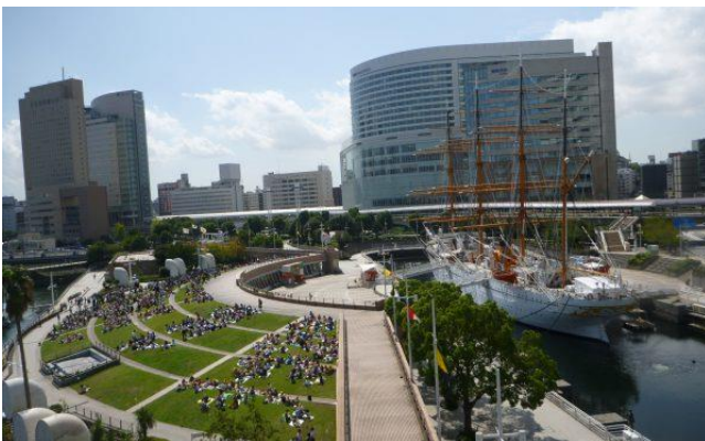
タワー棟からの芝生広場の風景