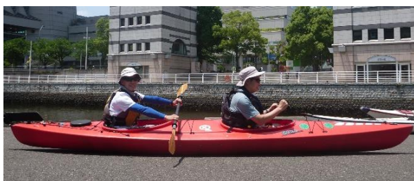
← タンデム(2人乗り)イメージ

※基本的には陸上で各自ペダルを調整してから乗艇しますが、水上に出てから調整が必要な場合このような作業が発生します。