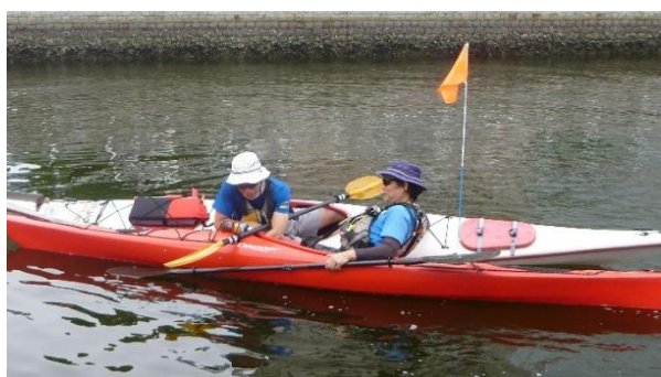
← ペダル調整時イメージ

※基本的には陸上で各自ペダルを調整してから乗艇しますが、水上に出てから調整が必要な場合このような作業が発生します。