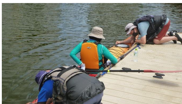
← 乗・降艇イメージ

人との間隔を確保するよう努めておりますが、艇（カヤック）の乗降時など、安全上やむを得ず指導者が近づいて指導する場合がございます。また、指導者の判断により一人乗りが難しいと思われる場合には、写真のようなタイプの艇に二人乗りとなります。予めご了承ください。