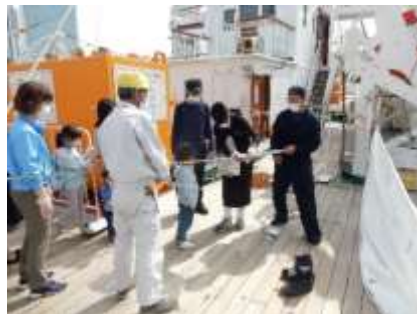
ワークショップ 実習生も使った 船の道具を持ってみよう

柳原良平アートミュージアムでは年3回、特集展示を開催しましたが、会期や内容を変更しての実施となりました。みなとみらい線日本大通り駅コン