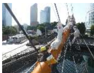
バウスプリット渡り