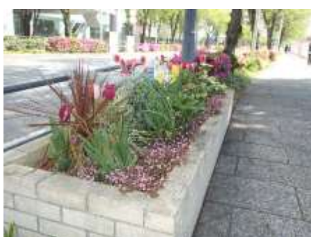
みなとみらい21まちかど花壇 (さくら通り)

プランター60個を配置し、季節に応じた草花の植替えを年4回行いました。また、昨年に引き続き、さくら通り歩道に横浜市が設置した企業協賛花壇（みなとみらい21「まちかど花壇」）の維持管理を受け持ち、職員による手入れとともにボランティア活動により地域環境の美化改善に貢献しました。