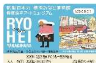
みなとみらい線1日乗車券