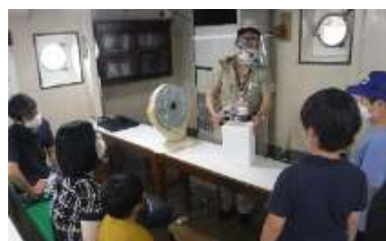
子ども向け「船の講座」