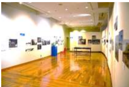
なるほど！ミナト横浜展 展示風景

博物館ボランティアは年間を通して活動中止としましたが、1～2か月に1回の頻度で博物館の活動や取り組みを文書でお知らせし、継続した博物館への協力を依頼しました。