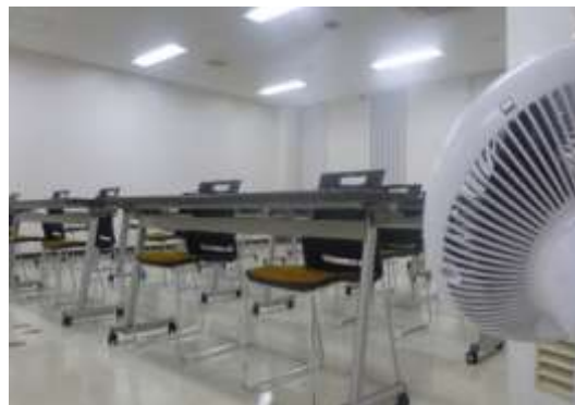
新型コロナウイルス感染症拡大防止対策を取った会議室

また、新型コロナウイルス感染症拡大防止対策として、アルコール消毒等の備品に加え、第3会議室と小会議室にサーキュレーターを配備するとともに、会議室毎に1日当たり1団体の貸出とし、利用者が安心して使用できる環境を整えました。