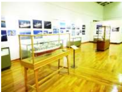
企画展「日本の練習船～海の上の学校」 展示風景