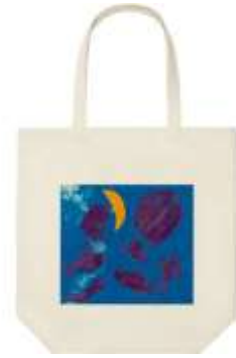
ユニクロトートバック

オ 特集展示「横浜港今昔」開催に伴い、横浜高速鉄道（株）とタイアッププロモーションとして、みなとみらい線全駅へのポスター掲出及びみなとみらい線横浜駅へのポスター連貼りを初めて実施しました。