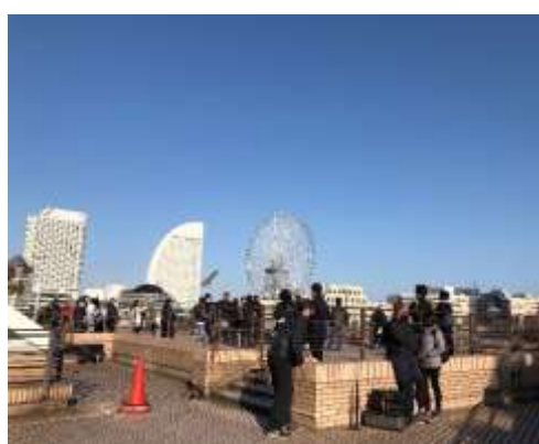
昼間 テレビドラマ撮影

緑地や帆船日本丸をはじめとした日本丸メモリアルパーク内の魅力的な空間やさまざまな施設や設備を利用し、テレビドラマ・映画・CM・雑誌などの撮影で合計99件の御利用をいただきました。