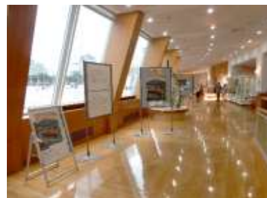
海事産業応援フォトコン作品展 展示風景