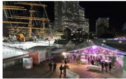
ICCA Asia Pacific Chapter Summit2020

また、「ICCA Asia Pacific Chapter Summit2020」のレセプション会場として夜間のアリーナ活用を行いました。