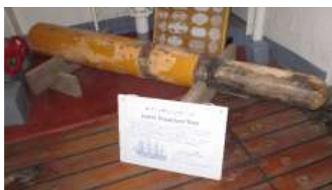
ロアーゲルンヤードのヤードアーム