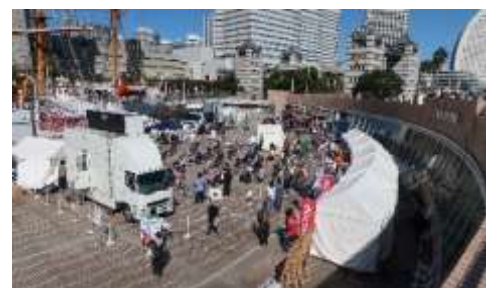
FMヨコハマ「沖縄チャンプルーカーニバル」

市民交流やコンサートをはじめとする音楽イベントなどを定期的で開催しました。秋にはFMヨコハマが「沖縄チャンプルーカーニバル」、冬にはホンダモーターサイクルジャパンがマスコミ向けの