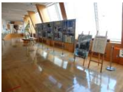
91 th 進水記念日 日本丸写真展

冬には、進水91周年を迎えた帆船日本丸の航跡を紹介した展示「91 th 進水記念日 日本丸写真展」、海運業・水産業を担う人材育成の場として大きな期待が寄せられている、練習船・実習船の役割について紹介する企画展「日本の練習船～海の上の学校」を開催しました。関連行事では、ワークショップ「実習生も使った、船の道具を持ってみよう」を実施しました。