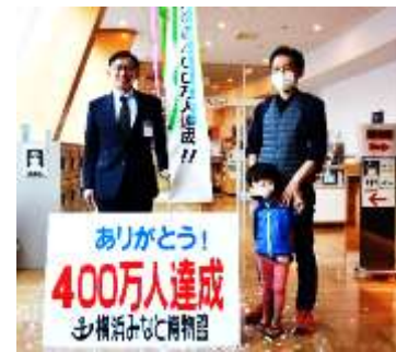
横浜みなと博物館入館400万人達成