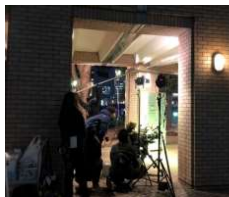
夜間 テレビドラマ撮影