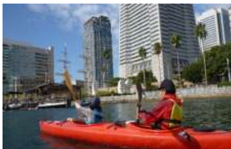
シーカヤック教室