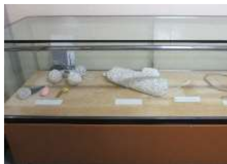
「船内で作られる小物たち」