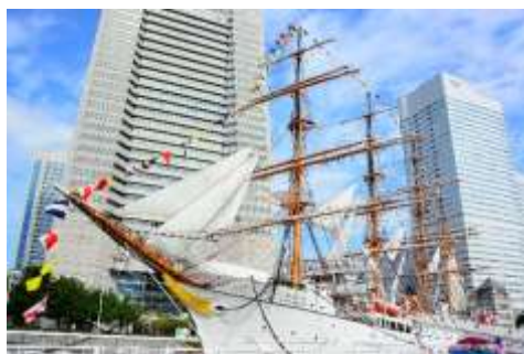
部分展帆と満船飾

これらの活動を通して、市民の皆様に帆船日本丸から得られる知識や経験を共有していただき、帆船日本丸の100年保存に対する理解を得られるように努めました。