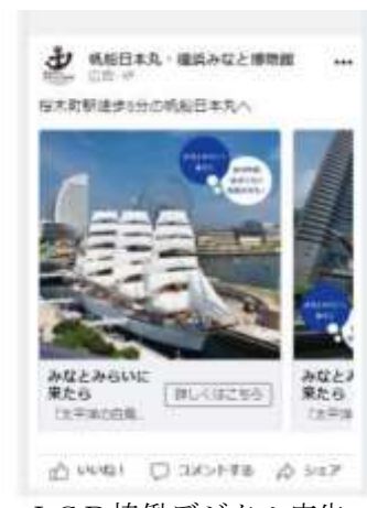
JCD協働デジタル広告

イ 共同事業体である株式会社JTBコミュニケーションデザイン（以下「JCD」という。）と協働し、新たに10月～1月中旬までデジタルを活用した集客施策を実施しました。Google及びFacebookならびにInstagramへの当施設コンテンツの広告掲載をし、表示回数で15,769,260回・クリック数で31,093件、当財団HPへのアクセス件数6,281件・獲得率（アクセス数÷クリック数）20.20%をマークすることができました。併せて今後のプロモーション戦略の参考にすることができました。