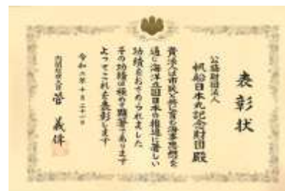
第13回海洋立国推進功労者内閣総理大臣表彰状

10月21日には、当財団が、昭和60年の公開以来、総帆展帆や海洋教室などの事業を行ってきたことにより、市民と共に育む海事思想の普及に貢献したことから、第13回海洋立国推進功労者内閣総理大臣表彰を受賞しました。