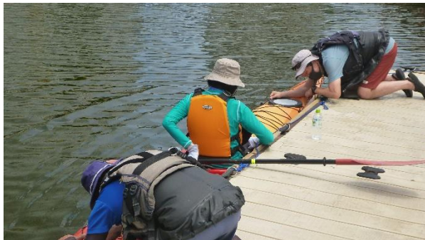
← 乗・降艇イメージ

人との間隔を確保するよう努めておりますが、艇（カヤック）の乗降時など、安全上やむを得ず指導者が近づいて指導する場合がございます。また、指導者の判断により一人乗りが難しいと思われる場合には、写真のようなタイプの艇に二人乗りとなります。予めご了承ください。