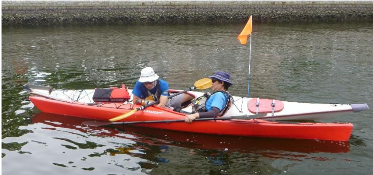
← ペダル調整時イメージ

※基本的には陸上で各自ペダルを調整してから乗艇しますが、水上に出たから調整が必要な場合はこのような作業が発生します。