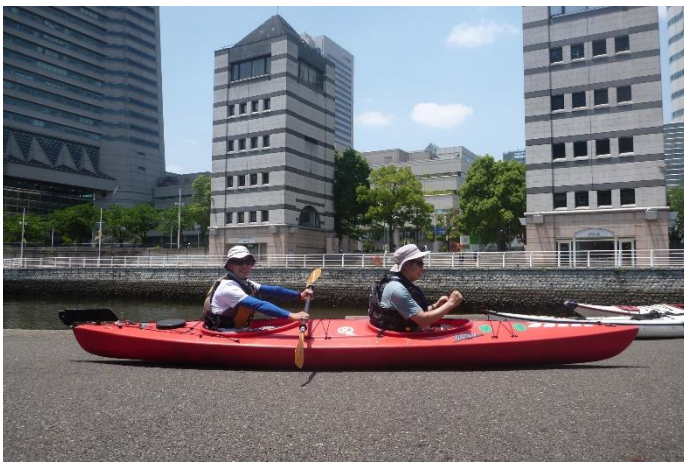
← タンデム(二人乗り)イメージ

※基本的には陸上で各自ペダルを調整してから乗艇しますが、水上に出たから調整が必要な場合はこのような作業が発生します。