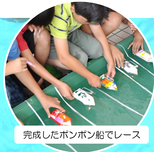
完成したポンポン船でレース

① 9:30~11:30 ② 13:30~15:30 / 対象: 小学4~6年生 各回: 30名 / 参加費: 800円 / 申込締切: 7/15(月・祝)必着