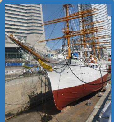
船体も塗りなおし、 きれいになりました！