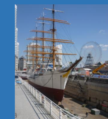
view spot の看板が目印！