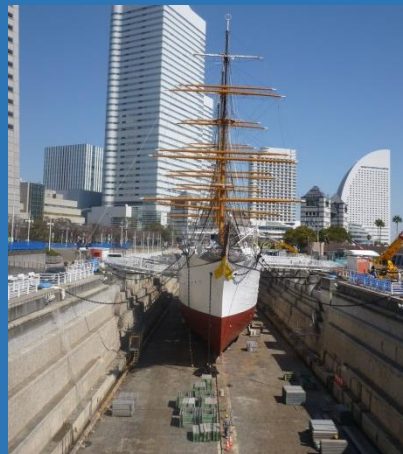
工事用の柵越しにドック の様子が見られます。

1号ドック 国重要文化財 No.1 Dock Important Cultural Property Designated by the National Government