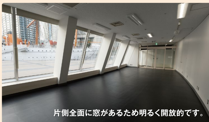
片側全面に窓があるため明るく開放的です。

日本丸前でのアリーナ利用時などのイベント開催時のスタッフルームやセミナー・会議利用、趣味・サークルの発表会、小展示スペース、頒布会などご利用いただけます。