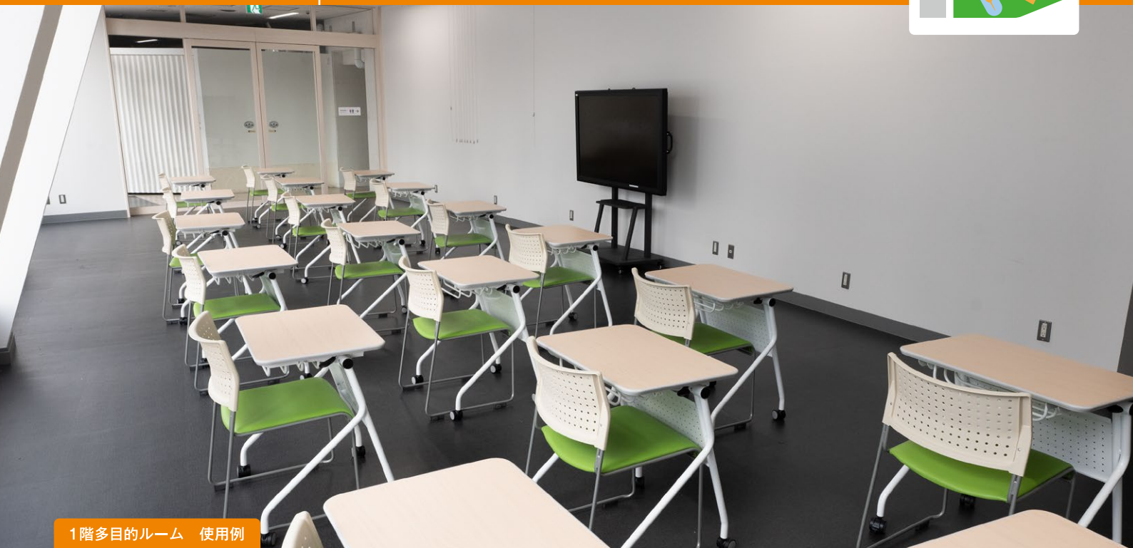
1階多目的ルーム 使用例

セミナー・会議利用、趣味・サークルの発表会などに。 目の前に国指定重要文化財帆船日本丸が見える明るい部屋です。