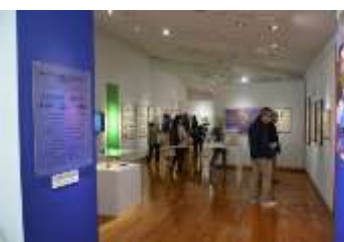
同 オープン日の会場風景