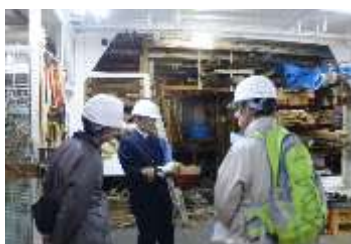
非公開エリア見学会 船倉