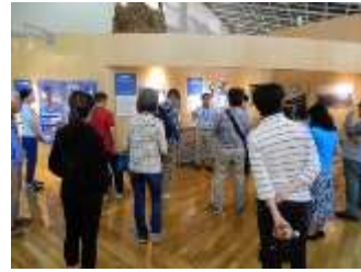
みなと博館長トーク

年度末には柳原良平アートミュージアムのオープンにあわせて、チケットカウンターや順路、館内設備等の一部を変更しました。