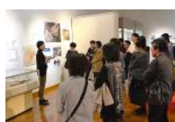
<新港ふ頭展> フロアガイド