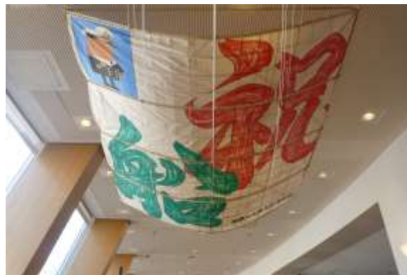
横浜みなと博物館1階フリーゾーンに相模の大凧ミニチュアを展示