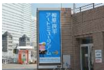
柳原良平アートミュージアム

特別展示事業では、「東日本大震災 第 6 回石巻かほく復興写真展」、企画展「国重要文化財指定記念 帆船日本丸の航跡」、企画展「江戸へ魚を送れ！一漁場としての横浜周辺の海」、「ずっと港のまんやかに 新港ふ頭展」を開催しました。それぞれの展覧会の会期中には、展示への理解をより深めていただくため、講演会やシンポジウムなどの関連事業を開催しました。