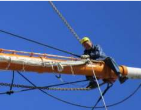
帆走艀装整備作業 帆走ギア交換