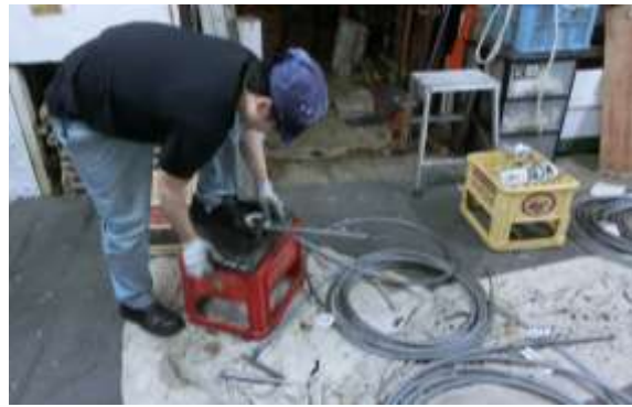
帆走艀装整備作業 ワイヤー加工