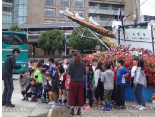
相模原公園写真コンテストのテーマ、サンパチェンスの花壇を日本丸メモリアルパークにて展示