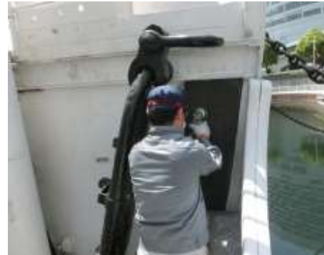
船体鋼材整備作業 発錆部手入れ