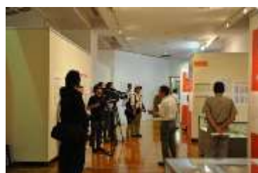
<帆船日本丸の航跡> プレス内覧会