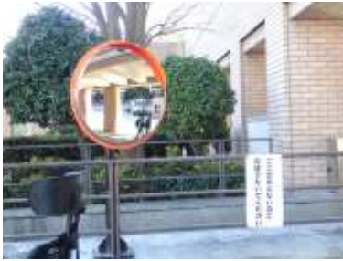
歩行者を守るカーブミラー設置

パーク内歩行者の安全を確保するため、車両通行路の見直しを行いました。これに併せて、パーク内2か所にカーブミラーを設置しました。