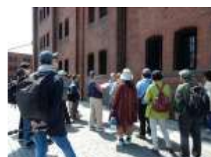
＜新港ふ頭展＞ 新港ふ頭散歩