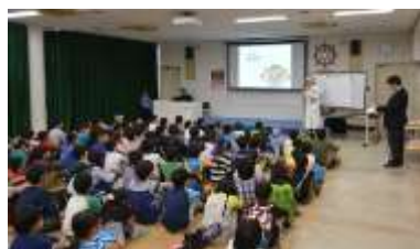
＜江戸へ魚を送れ！＞ さかなクン講演会