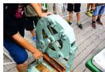
夏休み自由研究 ロープ作成