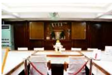
新春特別公開 神棚・正月飾り

加えて、特別イベントとして、夏休み期間中の小学生向け自由研究教室及び船長による大人向け船講座を開催しました。更に、非公開ゾーンの船内探検ツアー及び修繕工事期間中の見学会を開催することにより普段見ることのできない日本丸の姿を公開し、市民の皆様から帆船日本丸 100 年保存に対する理解を得られるように努めました。