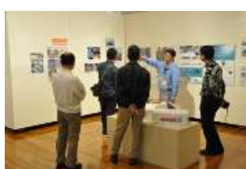
<江戸へ魚を送れ！> フロアガイド