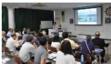
＜帆船日本丸の航跡展＞ 記念講演会