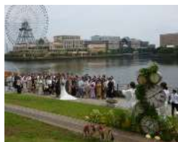
芝生広場で初めてのウェディングを実施