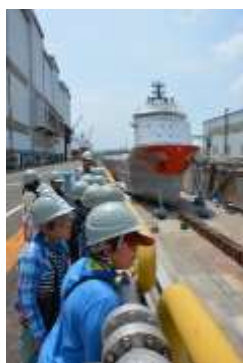
横浜みなとキッズクラブ 造船所見学会

年間を通して小・中学生及び大人を対象とした船の工作教室や海図教室など各種教育普及活動を積極的に行いました。毎年夏休みに実施している「船と港の夏休み自由研究」には、80人近い小学生の参加がありました。市内の小学校高学年向けには、海と船に親しむ活動を1年間通して行う「横浜みなとキッズクラブ」(全7回)を実施しました。