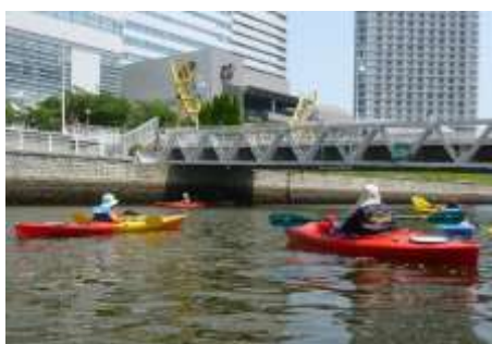
シーカヤック教室

10月28日(土)(雨天の為翌日は中止)に実施した第6回「帆船日本丸杯カヌーポロ大会」は、12チーム、83名の参加がありました。日本丸カヌーポロ教室から初めてこどものチームが試合に参加しました。