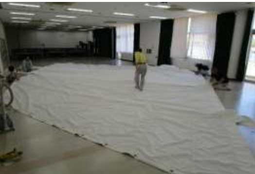
帆走艀装整備作業 セイル作成