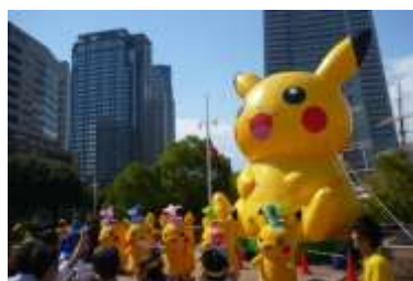
夏のピカチュウイベント

また、初めて芝生広場でウェディングを実施するなど、年間を通じてパークの有効活用を進め賑わいの創出を図りました。