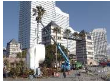
ワシントンヤシの剪定

ワシントンヤシをはじめとする高木の枯れ枝剪定を実施し、落下による事故の危険を排除しました。また、樹木の幹に発生した腐敗を早期に発見、伐採により倒木を防ぎました。