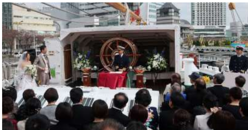
日本丸船上結婚式

平成 30 年 3 月に展帆ボランティア会員からの申し込みにより、5 年ぶりとなる日本丸船上結婚式を実施致しました。