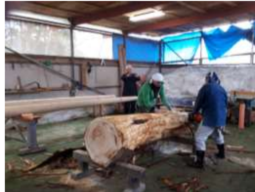
ロイヤルヤード製作工事