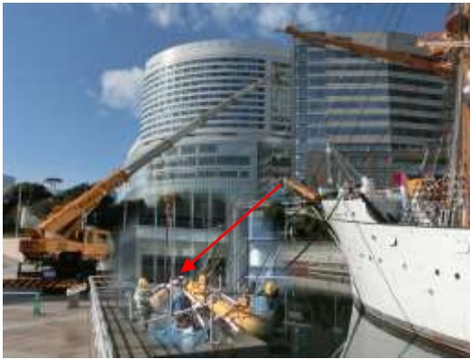
バウスプリット工事