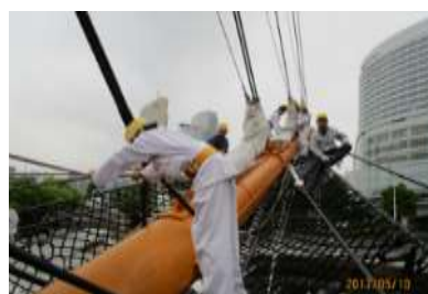
バウスプリット渡り