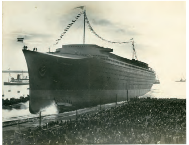
進水するノルマンディー 1932年10月29日

1935年に北大西洋航路に就航したノルマンディーは、処女航海で4日3時間2分、平均速力29.98ノット（時速約55.5km）で大西洋を横断し、大西洋を最も速く横断した船に授けられるブルーリボンの栄誉を獲得した