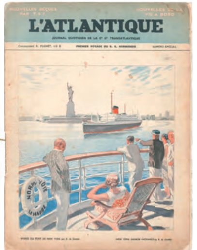
『ラトランティック』特別号 1935年6月2日

フレンチ・ライン船内紙の特別号。ノルマンディーの処女航海を記念し、ニューヨーク初入港の前日に発行された。ノルマンディーのデッキからフレンチ・ラインの客船と自由の女神を臨むイラストが表紙に使われている