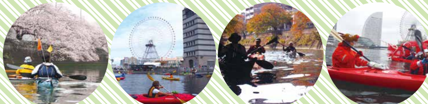
1年を通して開催している日本丸シーカヤック教室。横浜の四季折々の景色を海から楽しみましょう